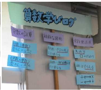
学んだことを自覚的に活用することを促す教室掲示 国語のみならず、他教科等でも掲示