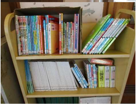
考えをつくるための情報の取り出しにもつながる