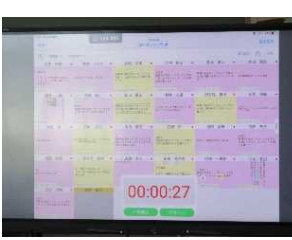
困りを共有し一人ひとりのめあてを設定→自分の学びを自覚