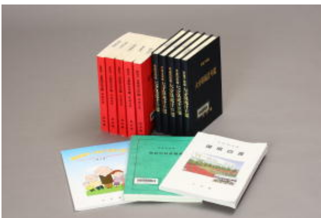
上段左：『公衆衛生年鑑』 上段右：『大分県統計年鑑』 下 段： 白書等

おもに、冊子やパンフレット・ポスターをはじめ、ビデオテープやCD-ROMなどの電磁記録媒体もあります