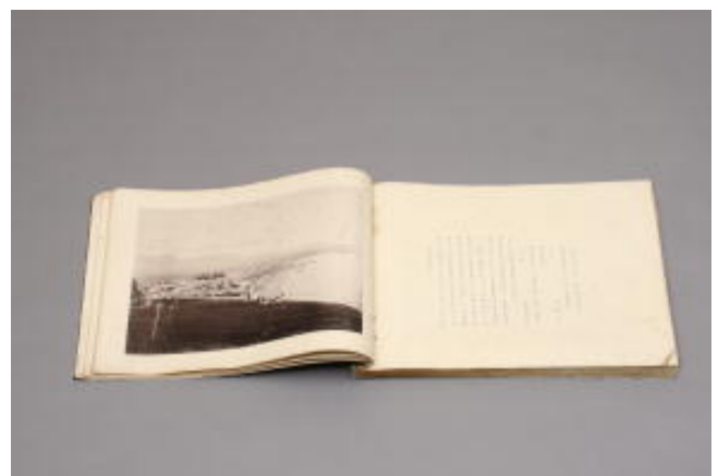
『大分県写真帖』（明治40年発行）