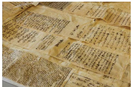
『香川真一旧邸襖の下張文書』