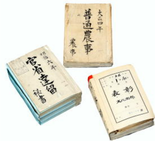
上：『普通農事 大正四年』/農事課 左：『官省達留 明治六年』/秘書課 右：『表彰 文化関係』/秘書公聴課

大分県公文書館では、明治4年の廃藩置県で大分県が誕生した以降の公文書を保存しています。