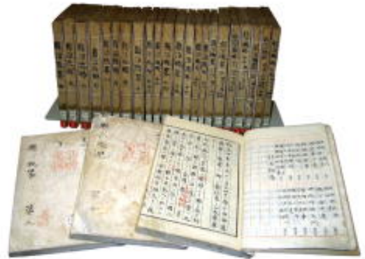
『縣治概略 第一卷～第二十五卷』