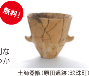
土師器甕 (原田遺跡: 玖珠町)

いつの時代でも台所は暮らしの中心であり、そこには便利な調理具や、食卓を彩る食器類があります。本展では台所でつかわれた各時代の遺物を大分県の資料とともに紹介します。