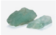
尾平鉱山産「蛍石」 (豊後大野市資料館蔵)