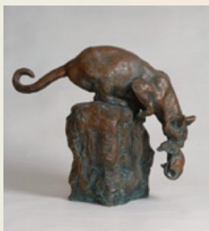
朝倉文夫《よく獲たり》1946年