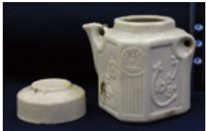
汽車土瓶 (大道遺跡群: 大分市)