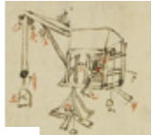
「和文稿本」 (先哲史料館寄託)