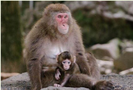
高崎山可爱的猴子