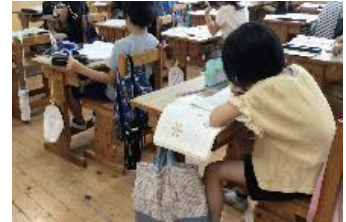
子どものふりかえり