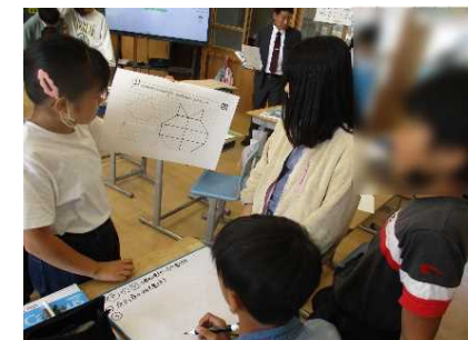
拡大図のかき方を グループで言語化する