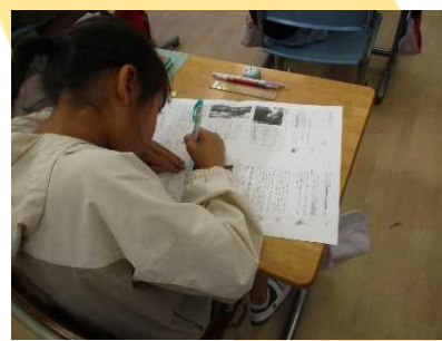
全文シートの活用