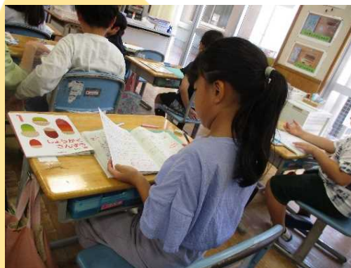
前時のノートを振り返ったり、既習事項を活用したり、考えをつくる手がかりを示したりする