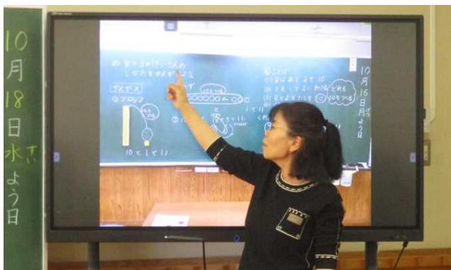
前時の板書から考え方を確認して 本時のめあてにつなぐ