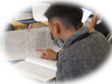
叙述と資料から、意見と根拠 を取り出す