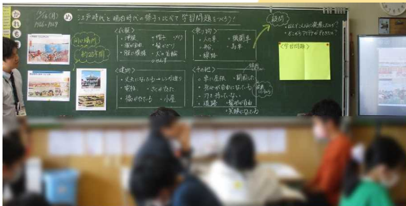
時代背景を4つの視点から比較し、単元の学習問題をつくる