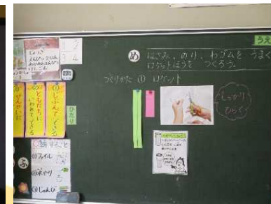
ひとりでするよう手順を明示