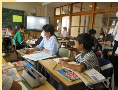
板書を手がかりに、単元の学習問題を話し合う