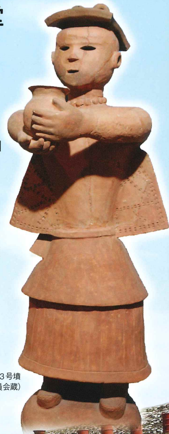
人物埴輪 八女市 立山山13号墳 (八女市教育委員会蔵)