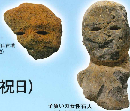
子負いの女性石人 八女市 童男山古墳群 (八女市教育委員会蔵)