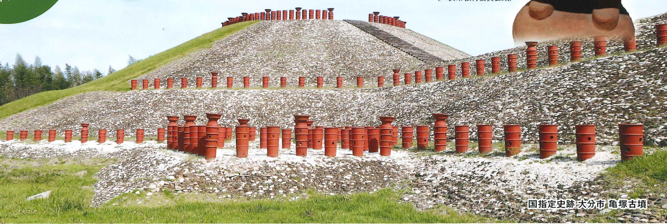
国指定史跡・大分市 亀塚古墳