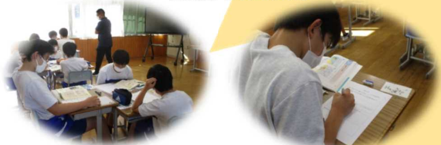
事例について自分の考えを書き、グループで比較したり関連付けたりする