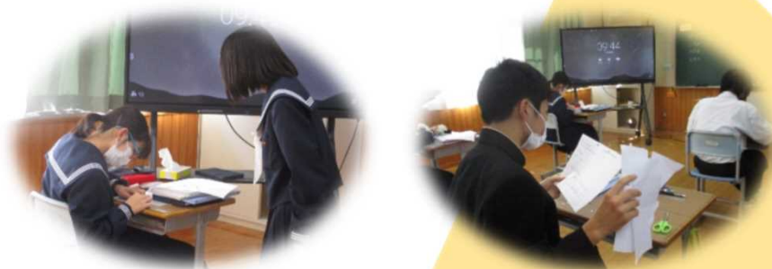
多角形の外角の和の求め方を複数の方法で考え、友だちの考えと比較する