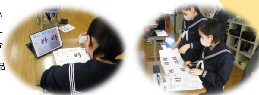
行書について、その特徴を視点をアドバイスを送り合い、自分の作品に生かす