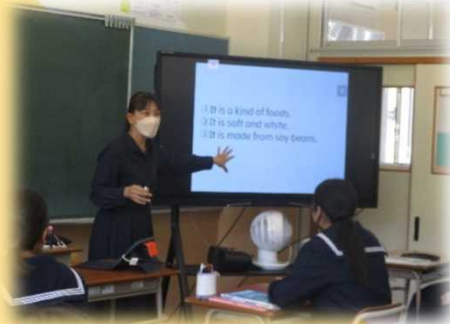
対象を英語で表す際、これまでに学習した英語表現を確認したり、それらを使って相手に考えを伝えたりする