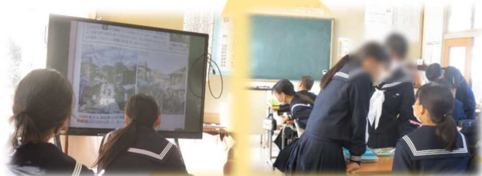
複数の資料を比較して、環境保全に関する情報を取り出す