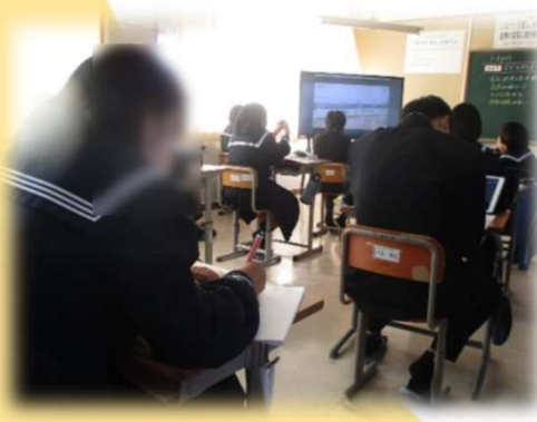
めあてを踏まえ、EUに関する動画を視聴し、EUの特徴に関する情報を取り出す