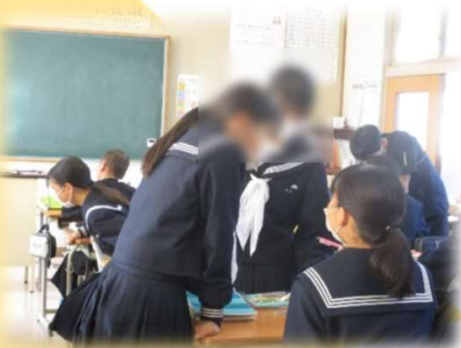
前時の学びを協働しながら振り返り、本時の課題解決につなぐ