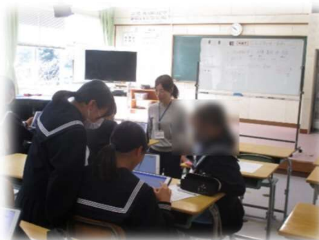
日本の音階を使った旋律づくり 思いや意図を共有する