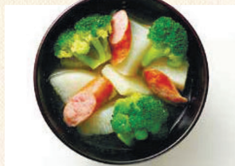
レシピ提供：公益社団法人 大分県栄養士会