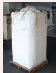
フレキシブル コンテナバック