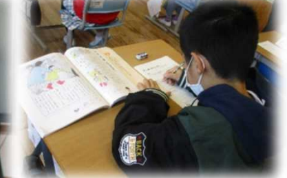
中心発問に対する自分の考えを書いて表現する