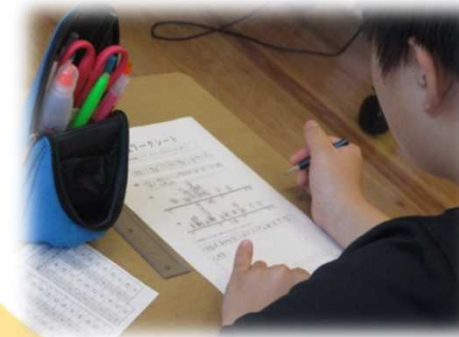
データの散らばり方の特徴を考え、書いて説明する