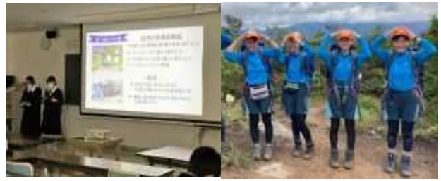
総合的な探究の時間発表会 山岳部インターハイ

1年：応用・標準クラス 2年：文系コース・数理コース(各習熟度別クラス) 3年：文I(就職・公務員) 文II(私立大・短大・専門学校) 文III(国公立大文系) 数理(国公立大理系・私立大理系)