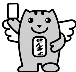
選挙のめいすいくん