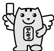
選挙のめいすいくん