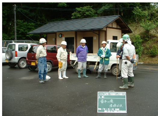
(今回の参加者です)

6月13日(水)に黄牛の滝下流の清掃を行ないました。今号ではその実施状況を紹介します。