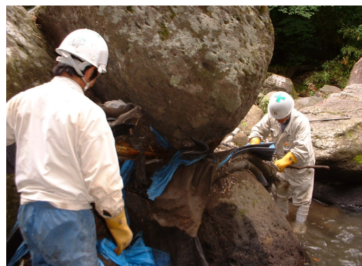
(引っかかったものを取り除いています)