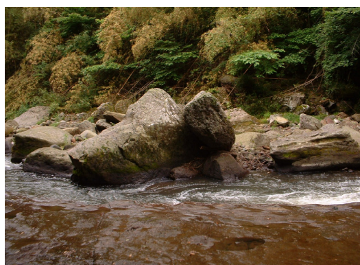
(清掃後の状況です)