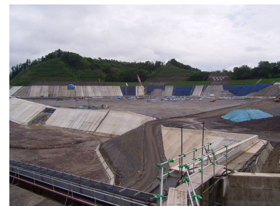
貯水池対策1工区状況