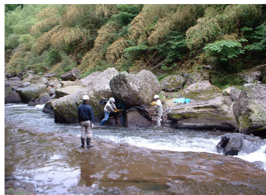
(引っかかったものを取り除いています)