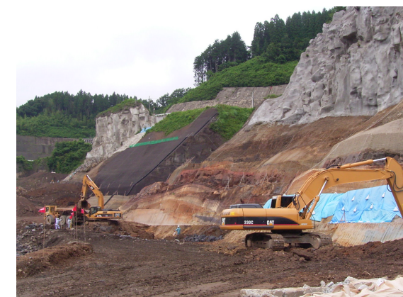
貯水池対策4工区状況