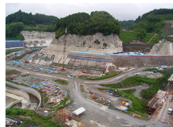
本体工区貯水池対策工状況