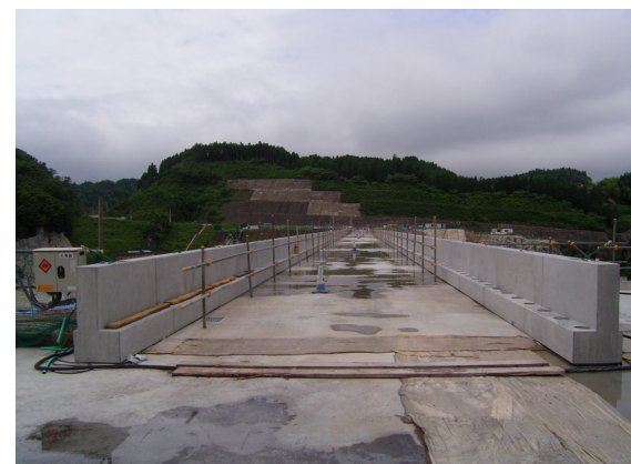
堤頂右岸側から左岸側見た状況