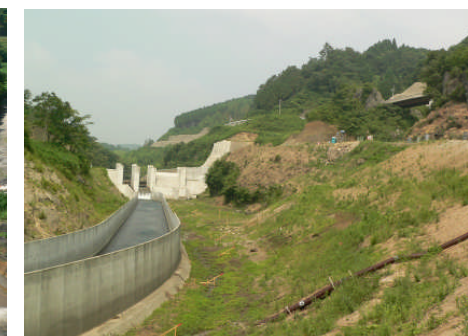
貯水池対策工事(7工区) 伐採完了状況