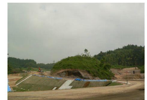
残土処理場工事(巢原地区) 掘削残土処理状況