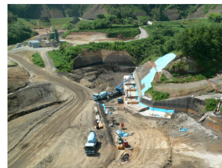
貯水池対策工事(1工区) 構造物生コン打設状況