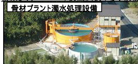
骨材プラント濁水処理設備

骨材プラントで発生する濁水を浄化しています。この他にダム堤体と原石山にも濁水処理設備があります。