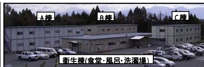
衛生棟(食堂・風呂・洗濯場)