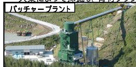
パッチャープラント

原石山で採取した原石を細かく砕き、コンクリートの原料の1つである砕石・砂を作ります。