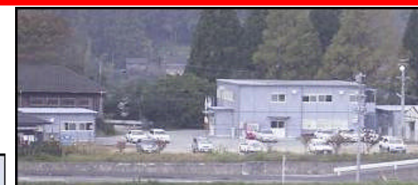
旧宮城小学校跡です。

いよいよ、11月より約3年に渡る本体コンクリート打設が始まります。今後とも宜しくお願いいたします!