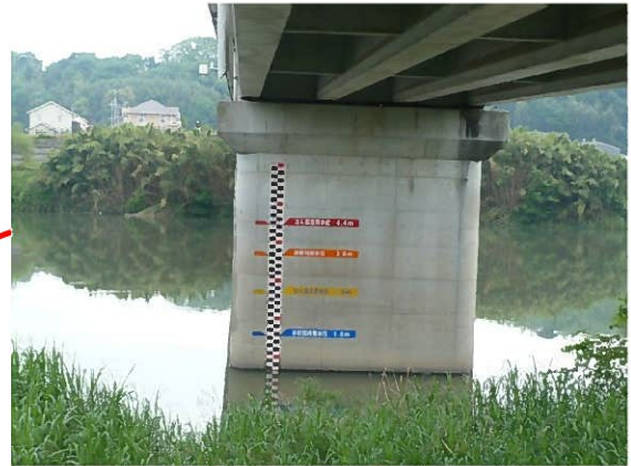
別府橋(水位計設置箇所)