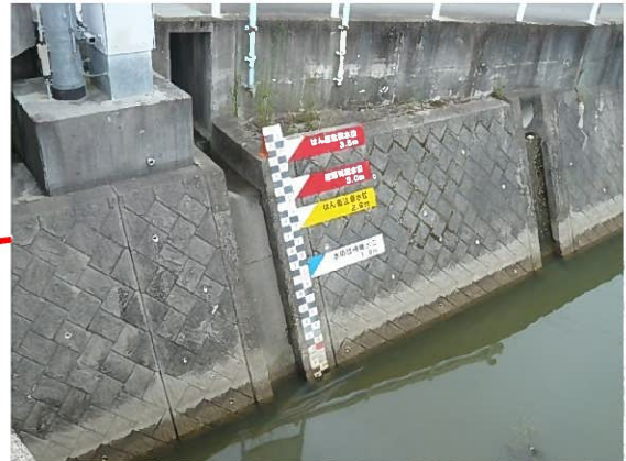
寄藻橋(水位計設置箇所)