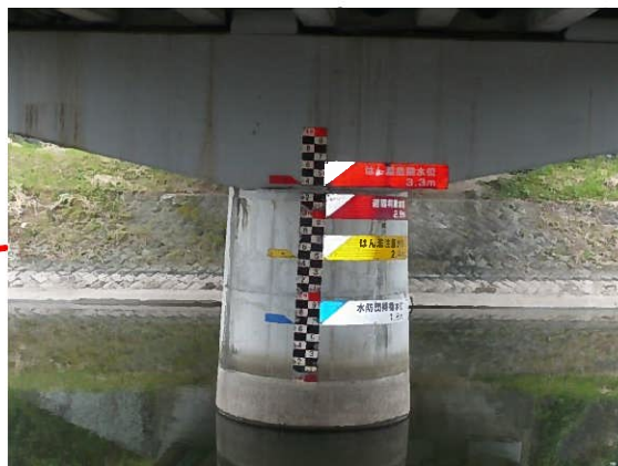
玄川大橋(水位計設置箇所)