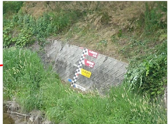
伊呂波橋(水位計設置箇所)