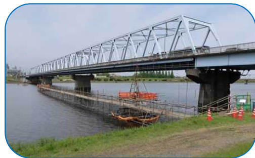
▲鶴崎橋地質調査（5月）

現在、関係機関（橋梁の設計に伴い乙津川・大野川を管理する国土交通省、交差点形状を決定するために公安委員会、国道197号に接続する市道を管理する大分市など）と協議を行いながら設計業務を進めています。