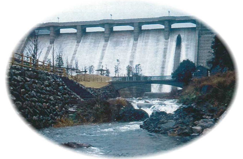
※上記写真は今回の状況ではありません

今回の洪水調節により、下流河川(丹過橋地点)において、河川水位を約0.1m低減させたと推測しています。