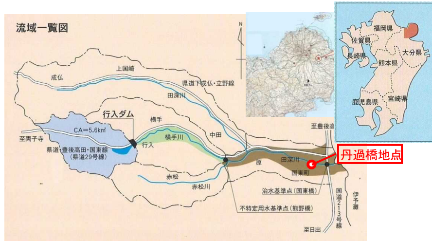
【 行入ダム位置図 】