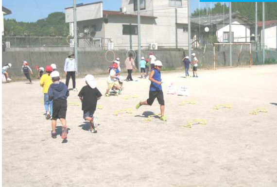
南小パワーアップタイム

めあてを「トライをとるための作戦を立てよう。」とし、チームでしっかりハスを回したり、ホール保持者について行くことを意識したりして、どのチームも意欲的に取り組むことができた。