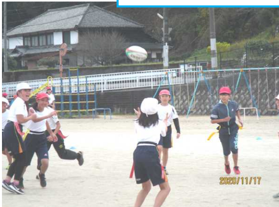
体育主任研修会で行った5年生「ラグビー」の授業の様子