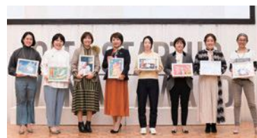
おおいたスタートアップウーマンアワード