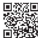
中小企業 支援ポータル