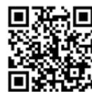
女性農業経営士 活動事例