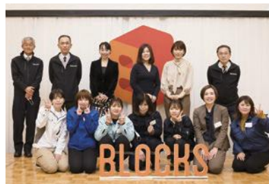
建設業界で働く女性向けのスキルアップセミナー