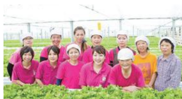
農業で活躍している女性たち