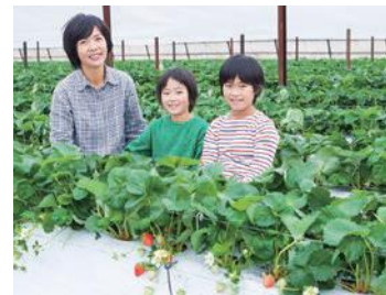
由布市 ベリーツ・いちご農家