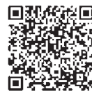
女性が輝くおおいた推進会議 女性活躍推進宣言企業

柔軟な働き方の導入や、継続就業に向けた就業環境整備の支援のほか、女性の登用やロールモデルの構築などモチベーション向上に向けた取組を推進