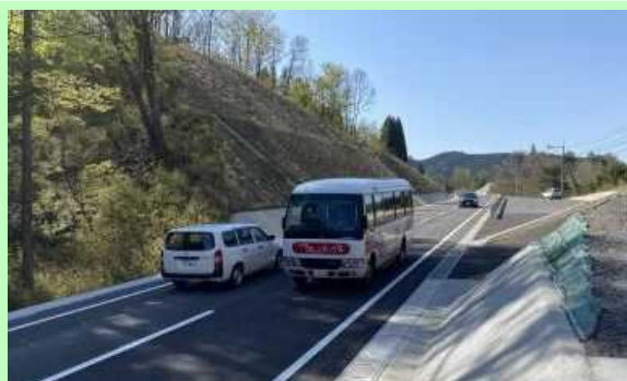
飯田高原中村線 二俣木工区（九重町）

令和3年度は、飯田高原中村線（二俣木工区）が部分開通し、九酔溪周辺地域のツーリズム振興に寄与しました。