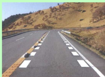
別府一の宮線（由布市）