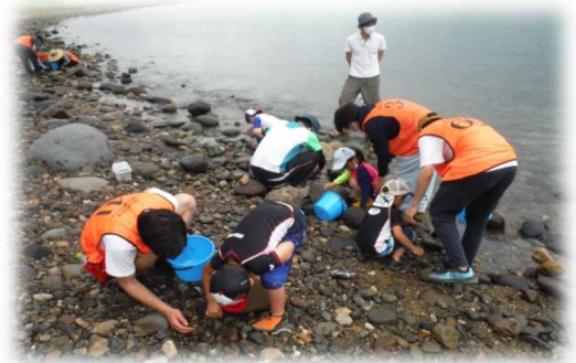
R3.7.25 田ノ浦ビーチ「マリンスクール '21」