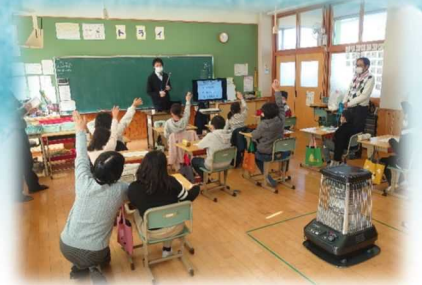
R3.12.2 飯田小学校 (九重町)