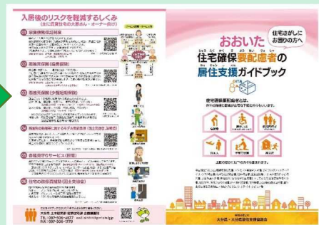
住宅確保要配慮者の居住支援ガイドブック（令和4年2月作成）