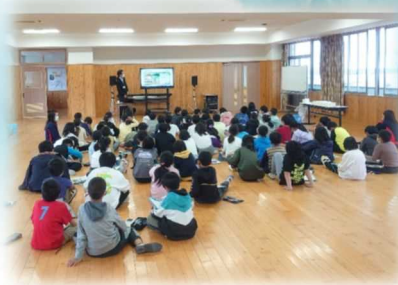
R3.10.21 豊岡小学校 (日出町)