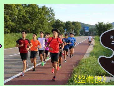
別府一の宮線（長者原工区）