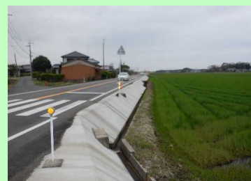
中津高田線（宇佐市）