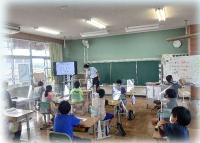
R3.10.1 天津小学校 (宇佐市)