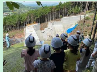
矢崎川砂防ダム見学 (宇佐市立佐田小学校)