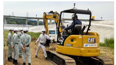
体験会（ICT 建設機械体験会）

本県においても、平成29年度からICT活用工事を試行しており、令和3年度は、適用工種を拡大するとともに、ICTを活用できる人材を育成するため、オンラインセミナーや体験会を開催し、普及拡大に取り組んでいます。