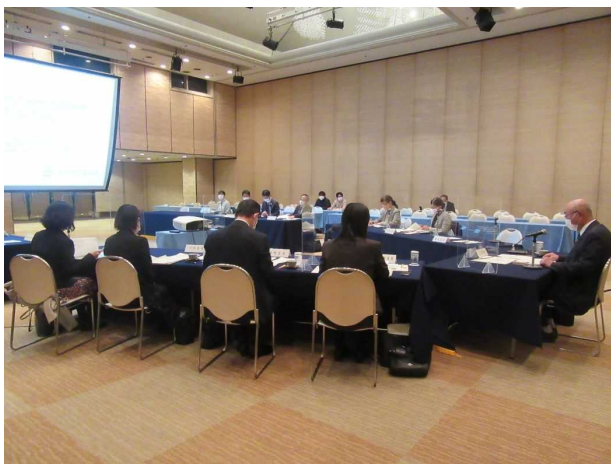
事業評価監視委員会の状況

令和3年度の事業評価監視委員会では、土木建築部、農林水産部あわせて事前評価対象6事業、再評価対象23事業、事後評価対象7事業の計36事業が審議され、各々の対応方針案について「妥当」であるとの審議結果が知事あてに答申されました。