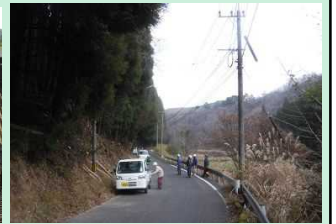
支障木等伐採 (玖珠山国線)