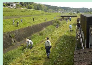
河川清掃活動 (玉田川)