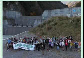
ふれあい砂防教室 (別府市立鶴見小学校)