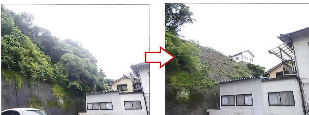
倒木の恐れのある立木の伐採

土木事務所では、災害発生時などに迅速な対応ができるよう、日頃から防災資機材を備蓄するなど地域防災力の向上に努めます。また、防災や生活環境の保全等を図るため、河川等の倒木・流木等の撤去や施設の修繕等を行います。