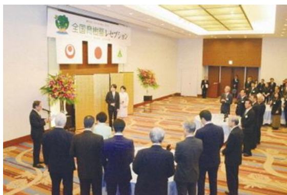
▲第43回全国育樹祭 レセプション