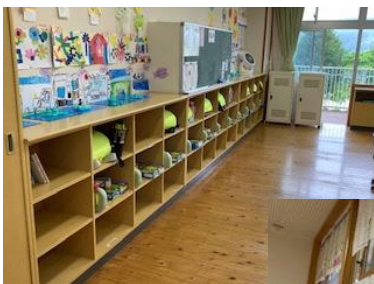
1年生のロッカーの整理整頓