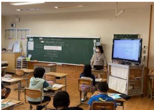
デジタル教科書を投影して指導