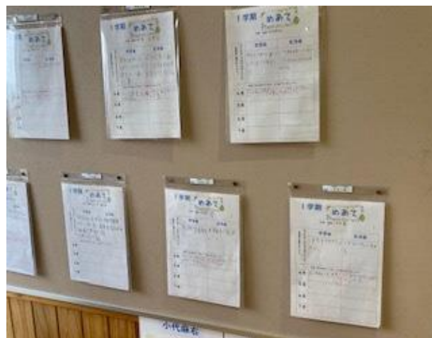
1学期のめあてを月ごとに振り返り