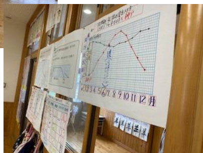
学習の足跡を教室に掲示