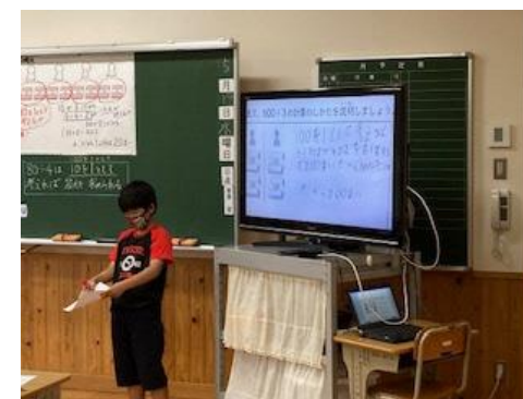
ワークシートを投影 ⇒ 児童発表