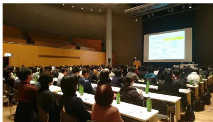
【地域移行・地域定着のための講演会】