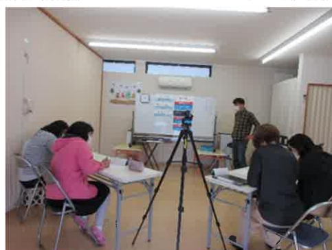
【ペアレントプログラム（研修会）】