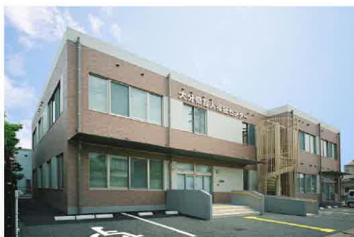
【大分県盲人福祉センター】 (大分県点字図書館)