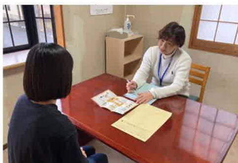
【発達支援コンシェルジュの個別相談】