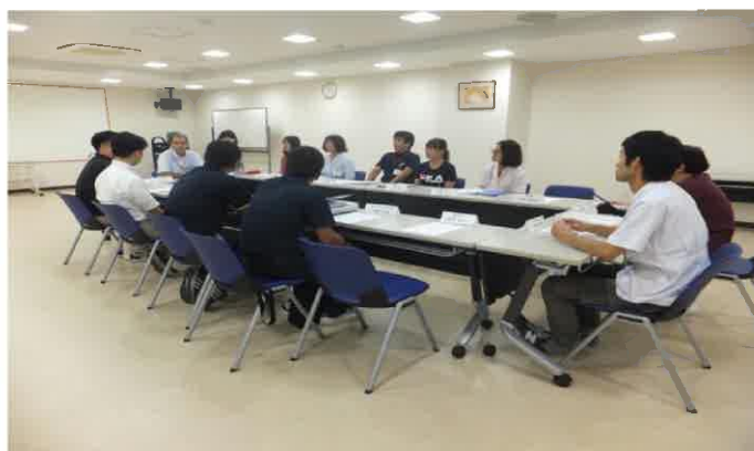
【精神障がい者の退院に向けた個別支援会議】