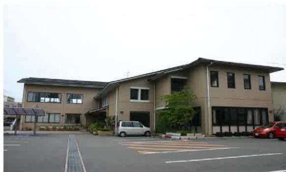
【大分県聴覚障害者センター】