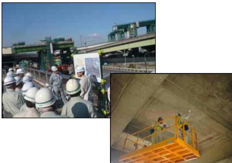
【現場講習会や技術交流】