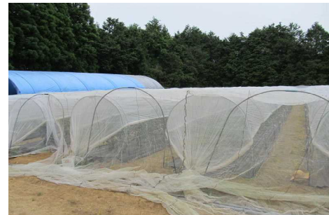
図 3 ハウス内タバコガ類成虫の誘殺数 (平成 26 年) 現地での展張状況 (平成 26 年) (フェロモントラップによる)