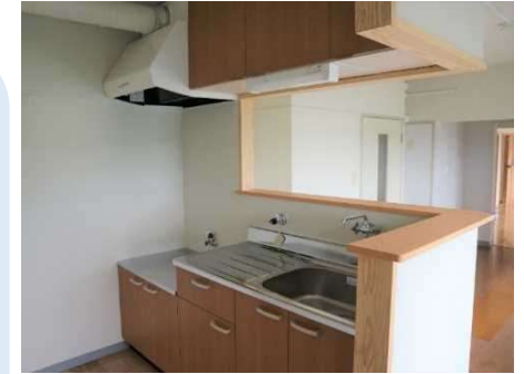
子育て世帯向け住戸の整備 (対面キッチンへの改修事例)