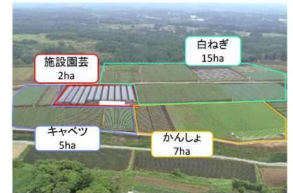
大規模園芸団地の整備(イメージ)