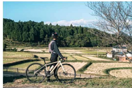
豊後高田市のアドベンチャー ツーリズムコース