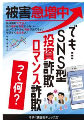
詐欺被害防止広報啓発