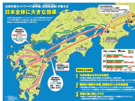
広域交通ネットワーク