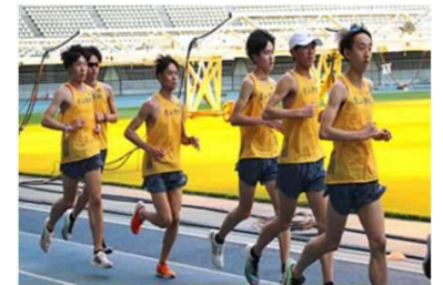
大学チームのスポーツ合宿