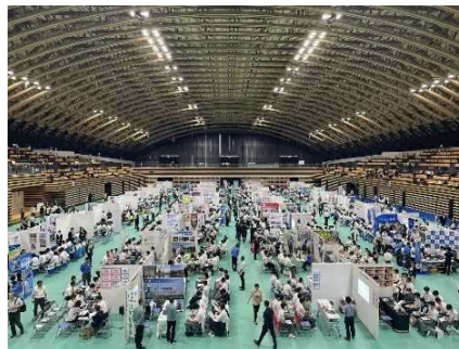
高校生向け企業説明会