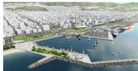
別府港再編イメージ図