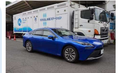
水素ステーションと燃料電池自動車