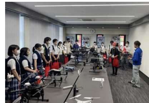
理工系人材育成に向けた企業訪問