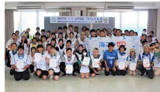
OITAスポGOMIブロック大会