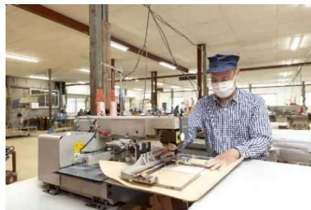
縫製現場での就労の様子