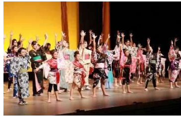
地域の芸術文化活動