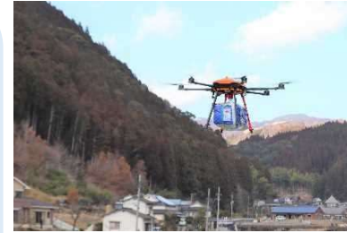
ドローンによる孤立集落への救援物資配送訓練