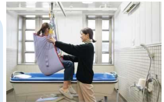
ノーリフティングケア (抱え上げない介護)