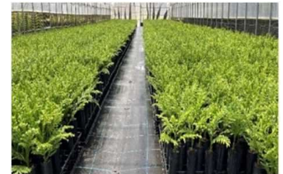
整備の進む早生樹育苗施設