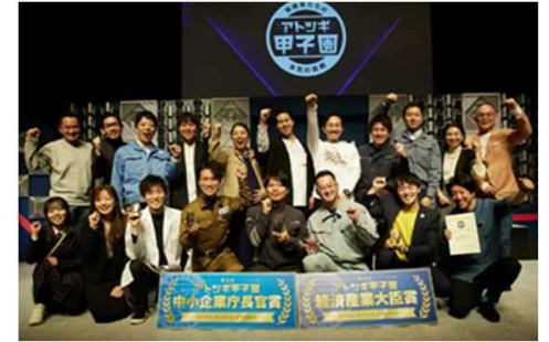
アトツギ甲子園決勝大会