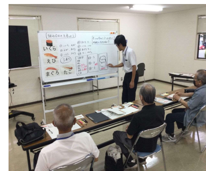
夜間中学模擬教室