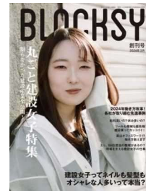
建設産業で活躍する女性を紹介する冊子「BLOCKSY」