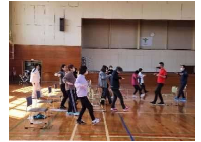
総合型地域スポーツクラブでの活動