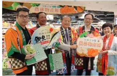
台湾プロモーション