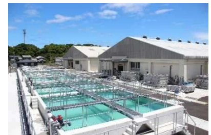
新たに整備した種苗生産施設