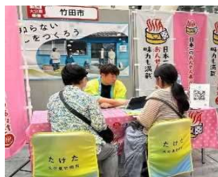
東京での移住相談会