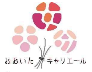
おおいたキャリアール